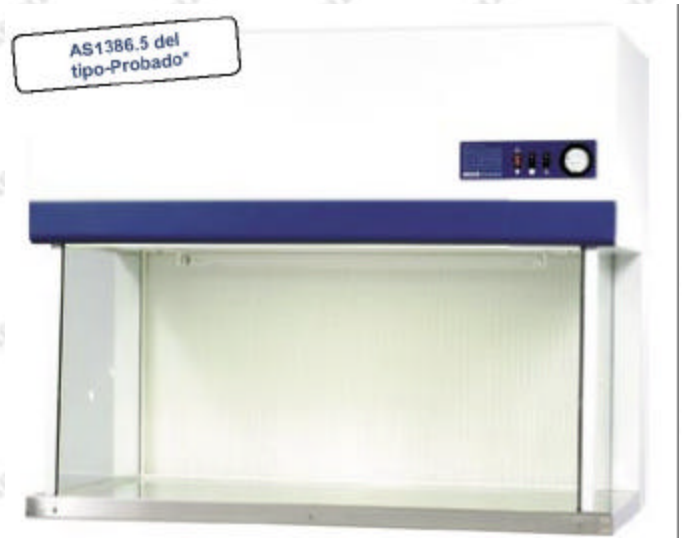
Basado en el desempeño de pruebas-tipo (pruebas piloto) llevadas a cabo en el modelo AHC-4A1 (Mostrada arriba con lámpara UV opcional) por el Instituto Australiano de ciencias médicas y veterinarias)

El sistema inteligente del extractor se compensa automáticamente para mantener flujo de aire mientras el filtro se carga (adicionalmente, pueden hacerse ajustes manuales para prolongar la vida de futuros filtros). Esta característica única elimina la necesidad de ajustar el control de velocidad constante al mismo tiempo que se asegura un desempeño óptimo y la protección del producto.